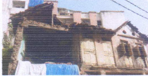
વલસાડના ધનભુરાણ ગામમાં જર્જરિત થયેલી ઈમારતોને તુરંત તોડવામાં આવે તેવી નોટિસ આપવામાં આવી છે.

વલસાડના ધનભુરાણ ગામમાં જર્જરિત થયેલી ઈમારતોને તુરંત તોડવામાં આવે તેવી નોટિસ આપવામાં આવી છે. આ નોટિસ અનુસાર જર્જરિત થયેલી ઈમારતોને તુરંત તોડવામાં આવે તેવી નોટિસ આપવામાં આવી છે. આ નોટિસ અનુસાર જર્જરિત થયેલી ઈમારતોને તુરંત તોડવામાં આવે તેવી નોટિસ આપવામાં આવી છે.